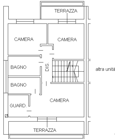
PIANO PRIMO h=2,70